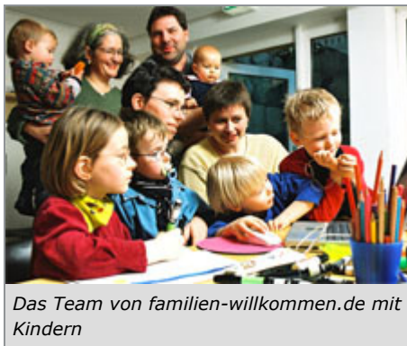
Das Team von familien-willkommen.de mit Kindern